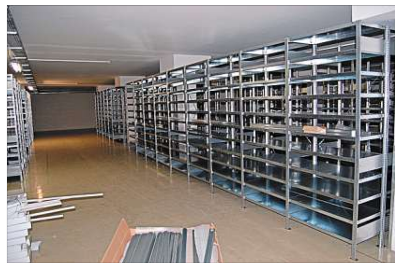
Eine zeitgemäße Logistik ist ein wichtiger Bestandteil moderner Unternehmensführung. Im Untergeschoss der Halle wird dafür alles vorbereitet.

noch eine Reihe von „Baumeisterarbeiten“ vorgesehen. Dabei sollen auch die Versorgungsanlagen für die Elektrofahrzeuge der Firma gebaut werden. Die Halle hat im Erdgeschoss eine Fläche von rund 3200 Quadratmetern. Davon sollen nach den Worten von Rudolf Brandhuber 650 m 2 für Präsentationszwecke genutzt werden, weitere 500 für die Kundendienstwerkstatt, und die Ausbildungswerkstatt. Rund 1000 Quadratmeter sind für die festen Mitarbeiter der Verwaltung vorgesehen. Dabei setzt Brandhuber auf flexible Büros mit mehreren