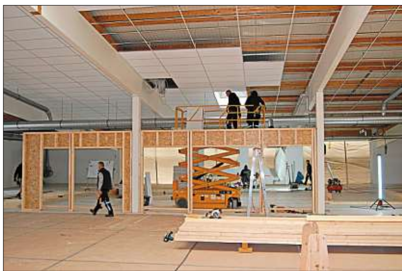
Größere Umbauarbeiten laufen derzeit in der Halle an der Lohgerberstraße. Das Gebäude wird für die „Brandhuber“-Erfordernisse hergerichtet.